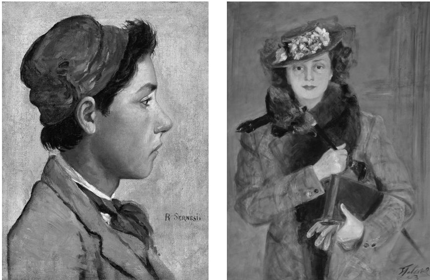
Fig. 2. Raffaello Sernesi, Florentine brat , about 1861, oil on canvas, 30,5x24 cm, Crema, Civic Museum of Crema and Cremasco (inv. Bo573).