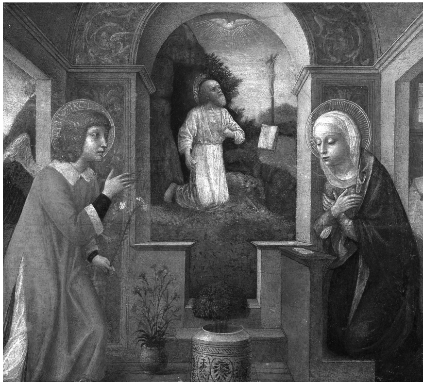
Fig. 1. Vincenzo Foppa, Annunciation with the penitent Saint Jerome , about 1460-1490, tempera on panel, 51x64 cm, Crema, Civic Museum of Crema and Cremasco (inv. Bo558).