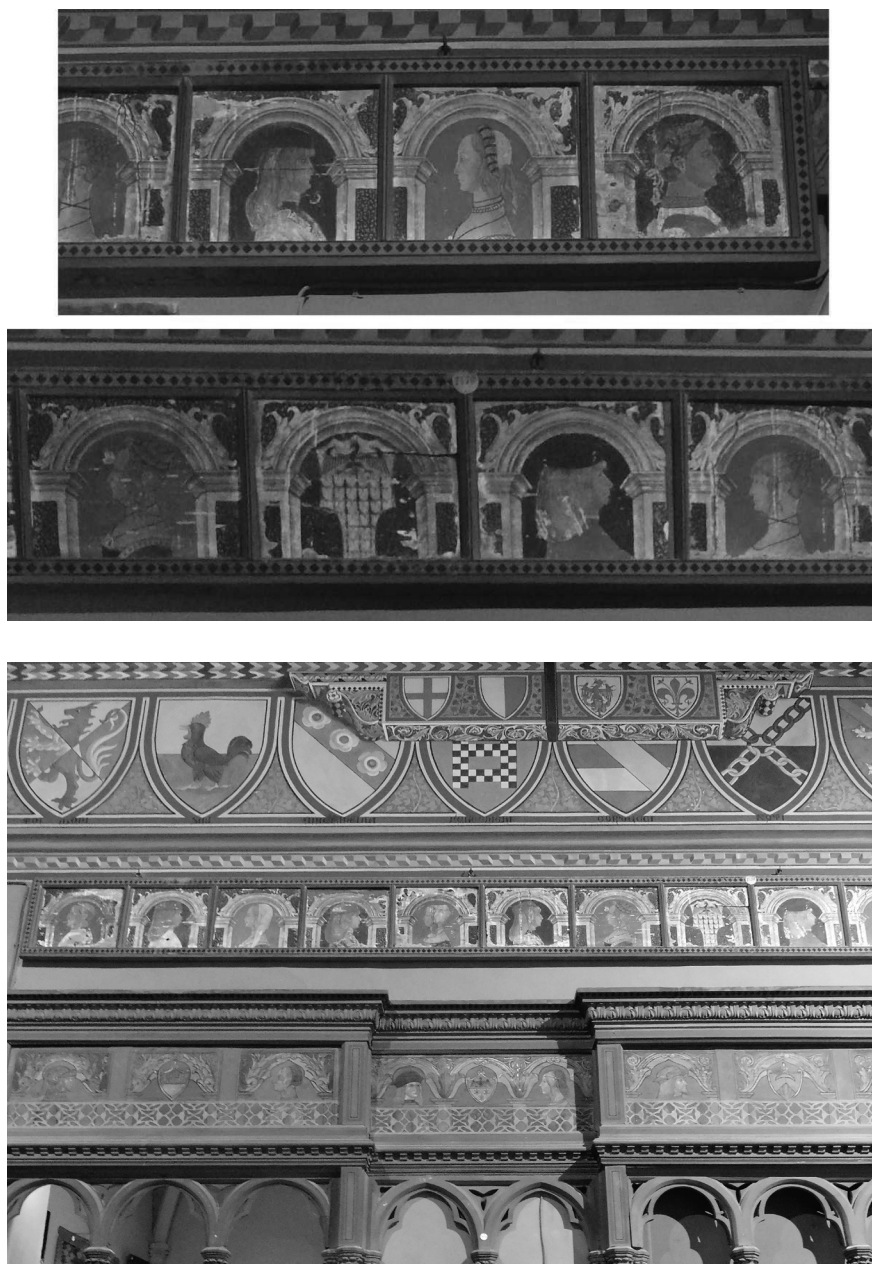
Fig. 11. Bottega cremasca, tavolette da soffitto, ultimo quarto del XV secolo, tempera su tavola, Firenze, Museo Stibbert, Sala Giapponese.