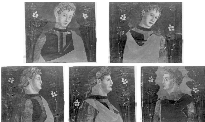
Fig. 8. Bottega cremasca, tavolette da soffitto, ultimo quarto del XV secolo, tempera su tavola, collezione privata (vendita Finarte).

meri a matita e a tempera rossa apposti sul retro come in quelle ancora in loco . Su questa, appena sovrapposto, si rileva inoltre una interessante etichetta cartacea parzialmente strappata, ma comunque leggibile: «Duveen-Brothers Inc. / Gallery / 18 [th East] 79th Street / [...]» che si riferisce a una delle più importanti dinastie di mercanti d'arte attiva, tra la fine del XIX e la metà del XX secolo, a Londra, Parigi e New York 57 . L'indirizzo è quello della nuova sede statunitense in cui la ditta si spostò nel 1951 58 , epoca coerente con lo smontaggio delle tavolette di villa Rossi Martini. La medesima etichetta compare anche sul retro di altri due pannelli della stessa serie venduti a Vienna nel 2006 da Dorotheum 59 ,