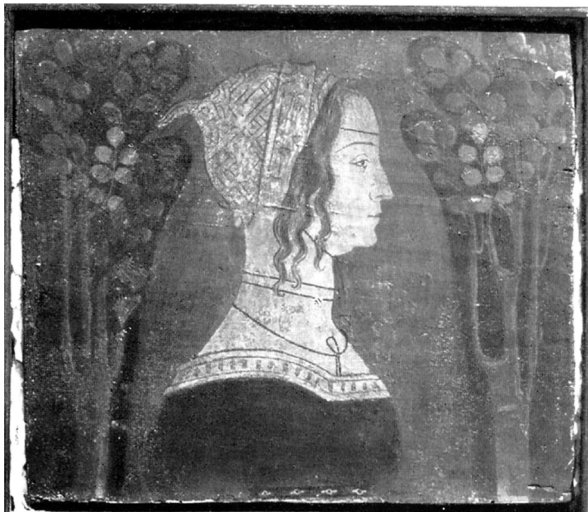
Fig. 12. Bottega cremasca, tavolette da soffitto, ultimo quarto del XV secolo, tempera su tavola, collezione privata (già collezione Hartmann).

che potrebbe essere in successivo rifacimento e non un originale quattrocentesco ridipinto.