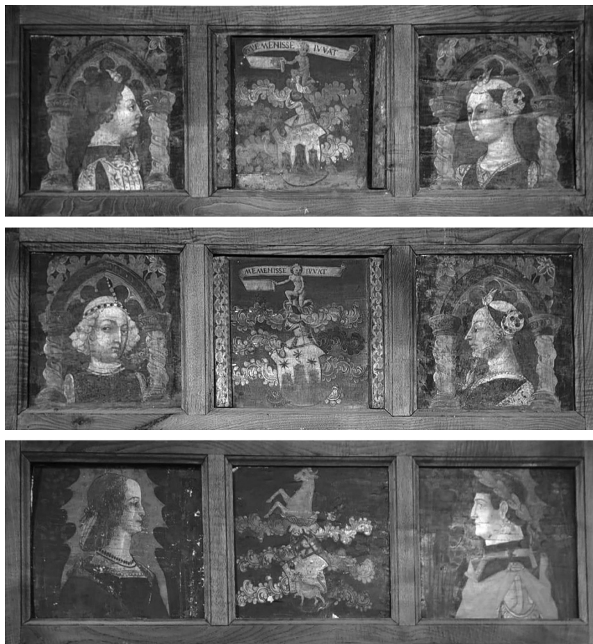
Fig. 3. Bottega cremonese e bottega cremasca, tavole da soffitto, terzo e ultimo quarto del XV secolo, Bracciano (Roma), Castello Orsini Odescalchi.

Quando alla fine dell'Ottocento fu ereditato dal principe Baldasare Odescalchi, l'edificio versava in stato di degrado ed era completamente privo di arredi 18 . Odescalchi, inserito nell'ambiente culturale