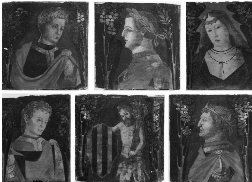
Fig. 7. Bottega cremasca, tavolette da soffitto, ultimo quarto del XV secolo, tempera su tavola, collezione privata.