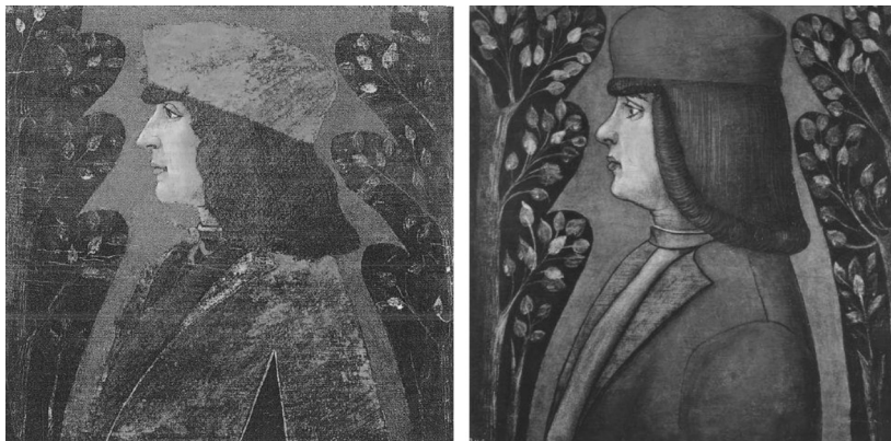
Fig. 2. Bottega cremasca, tavolette da soffitto, ultimo quarto del XV secolo, tempera su tavola, Praga, Národní Galerie e già Vienna, E&A Galleries.

rotheum a Vienna nel giugno 2024 14 , mentre i modelli maschili, seppur molto ridipinti, sembrerebbero riproposti nella tavola della Národní Galerie, Galleria Nazionale di Praga 15 , e in quella segnalata da Federico Zeri 16 , venduta dalla E&A Galleries di Vienna, casa fondata dai fratelli Silberman attorno agli anni Venti del Novecento.