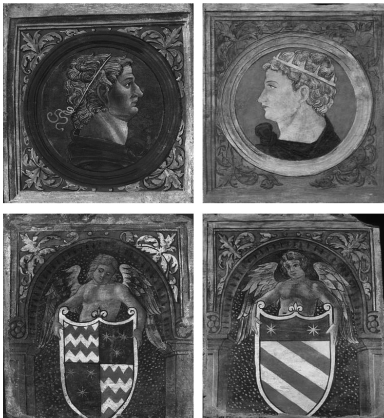
Fig. 13. Bottega cremasca, tavolette da soffitto, 1500 circa, tempera su tavola, Londra, Victoria and Albert Museum.

La prima conta quindici manufatti di forma quadrangolare, con profili di imperatori laureati e incoronati inseriti in oculi decorati da mascheroni o elementi vegetali ed, entro un'arcata che richiama i decori fitomorfi degli altri pannelli, stemmi araldici: uno sconosciuto, due Vimercati e altrettanti Malatesta. Anche in questo caso sembra che le insegne narrino un'unione matrimoniale 89 , quella celebrata attorno al