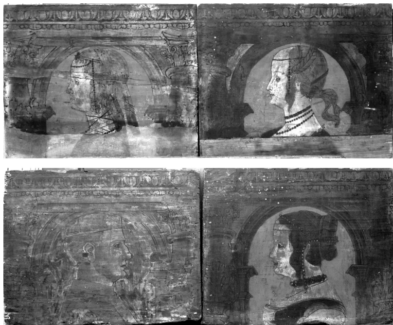
Fig. 4. Bottega cremasca, tavolette da soffitto, ultimo quarto, fine del XV secolo, collezione privata.

Tre pannelli decorati con l'insegna dello stesso casato, coincidenti in ogni dettaglio – iconografia, stile e gamma cromatica dei lambrecchini – si trovano nella Gothic Room dell'Isabella Stewart Gardner Museum di Boston montati, esattamente come nella West Dean House, nella parte alta delle pareti assieme ad altri sessantacinque manufatti afferenti a due distinti soffitti. Gli stemmi fanno parte di un primo nucleo composto da trenta pannelli a ritratti acquistato nel luglio 1888 a Venezia 21 , presso Antonio Marcato; un secondo insieme di trentotto tavolette, probabilmente anch'esse cremasche 22 , fu comprato nel settembre 1899