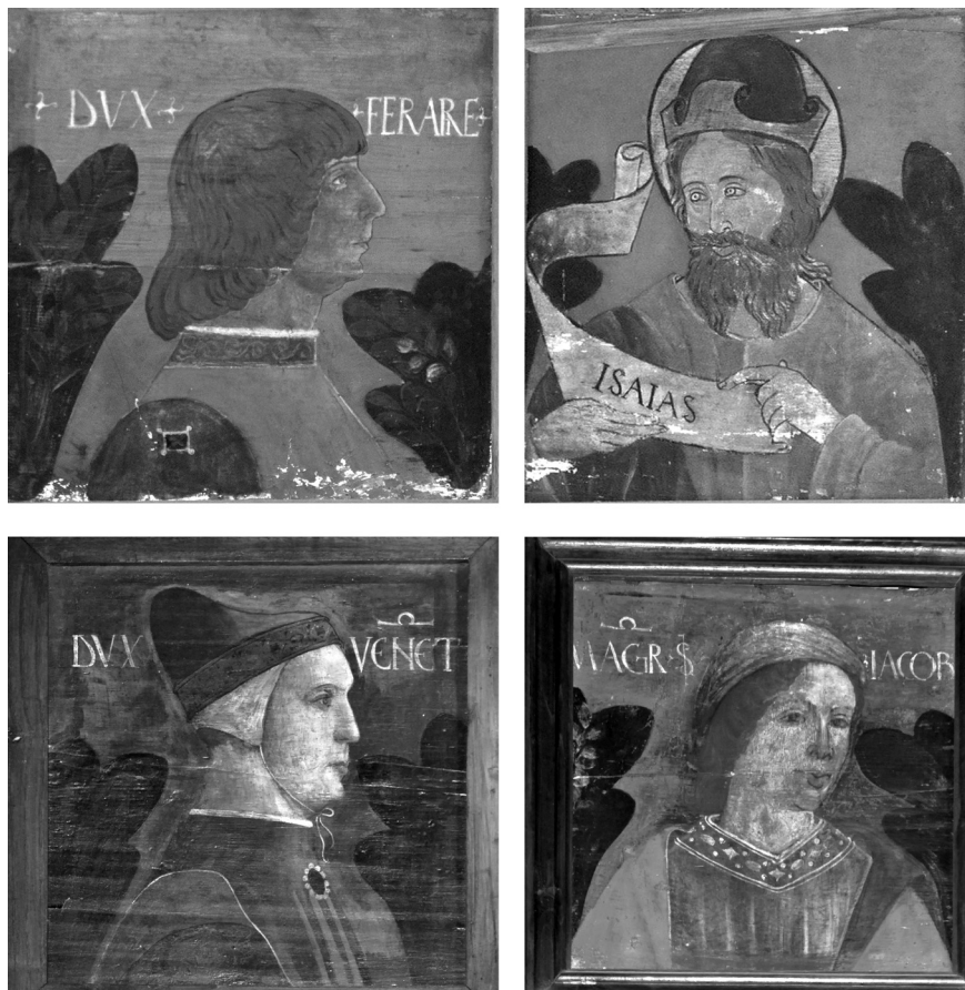
Fig. 16. Bottega cremasca, tavolette da soffitto, ultimo quarto del XV secolo, tempera su tavola, dall'alto: Portofino (Genova), Castello Brown e Lonato del Garda (Brescia), Casa del Podestà.

riscoperta delle tavole da soffitto padane, a oggi. La mole di manufatti in circolazione è molto più ampia di quanto ci si possa immaginare e crea una tentacolare, labirintica serie di intrecci che, dalla realtà locale, proietta anche la produzione cremasca di tavolette nelle dinamiche del collezionismo nazionale e internazionale.