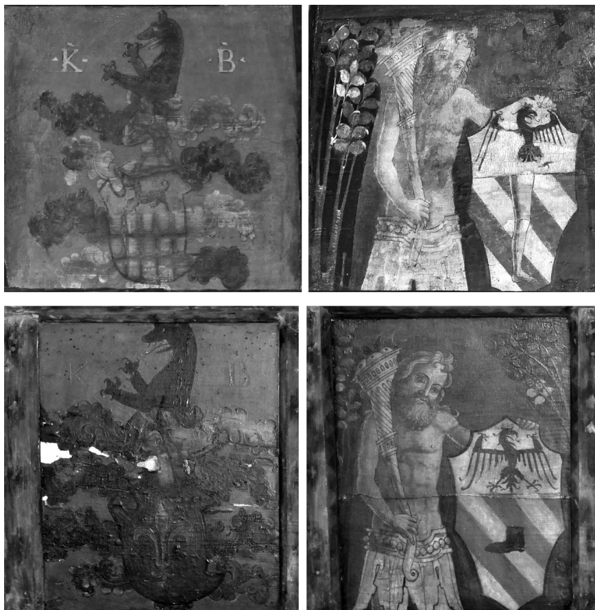
Fig. 6. Bottega cremasca, tavolette da soffitto, ultimo quarto del XV secolo, tempera su tavola, dall'alto: Lonato del Garda (Brescia), Casa del Podestà e collezione privata.

osservano nei pannelli, identici per stile e iconografia, collocati tra il 1892 e il 1895 41 nel porticato di accesso del palazzo voluto dai fratelli