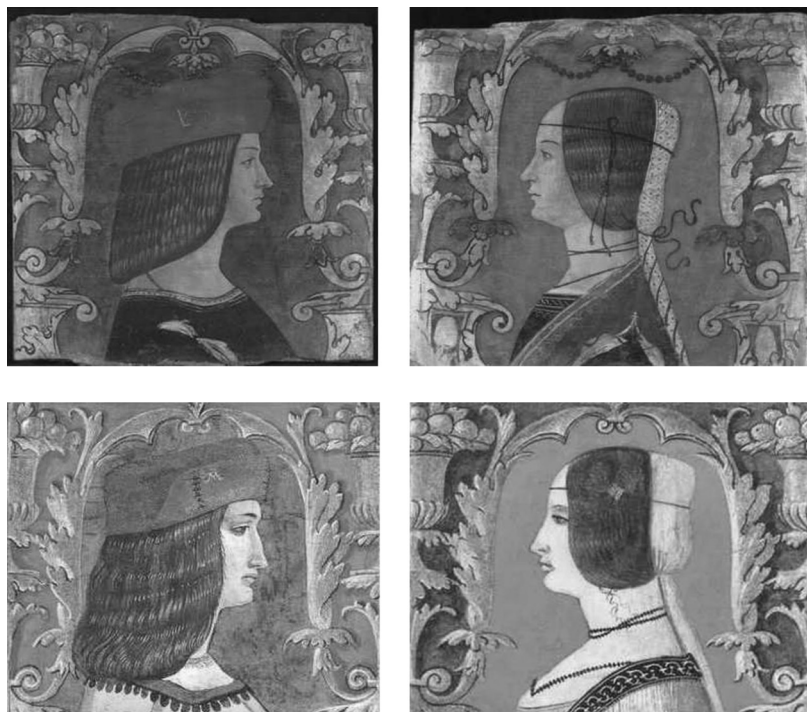
Fig. 14. Bottega cremasca, tavolette da soffitto, ultimo quarto del XV secolo, tempera su tavola, in alto Londra, Victoria and Albert Museum, in basso Crema, Banco BPM, già palazzo Vimercati.

Lupi avvenute sullo scadere del XV secolo 94 . I due cicli, cronologicamente prossimi e prodotti dalla medesima bottega artigiana, propongono, esattamente come in due varianti cremonesi della 'Colomba' 95 , la stessa