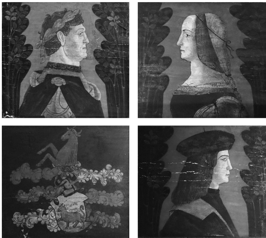
Fig. 1. Bottega cremasca, tavolette da soffitto, ultimo quarto del XV secolo, tempera su tavola, Chichester (Sussex), West Dean College.

XV secolo; un fenomeno di reiterazione in edifici di diversa proprietà che, nel tardo Ottocento, diede luogo a una circolazione collezionistica equiparabile a quella rilevata a Cremona per le numerose varianti della cosiddetta serie del ‘monastero della Colomba’ 8 .