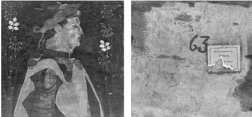
Fig. 9. Bottega cremasca, tavolette da soffitto, ultimo quarto del XV secolo, tempera su tavola, collezione privata (vendita Lucas).

a indicare che nelle collezioni Duveen era presente un lotto molto più consistente di questi manufatti 60 .