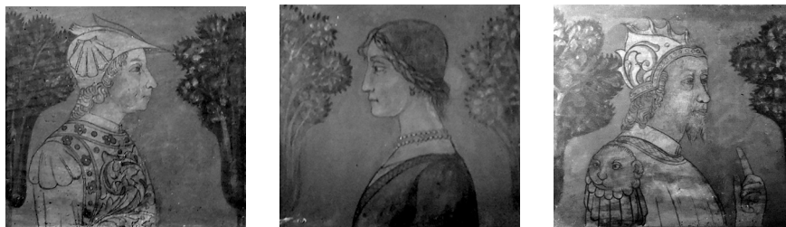
Fig. 10. Bottega cremasca, tavolette da soffitto, ultimo quarto del XV secolo, tempera su tavola, Firenze, Museo Stibbert, Scala dei Soli.

caratterizzati da un diverso uso della linea, decisamente marcato, che definisce mezzibusti maschili quasi a monocromo, di cui si conserva una decina di esemplari anche al Museo Stibbert di Firenze.