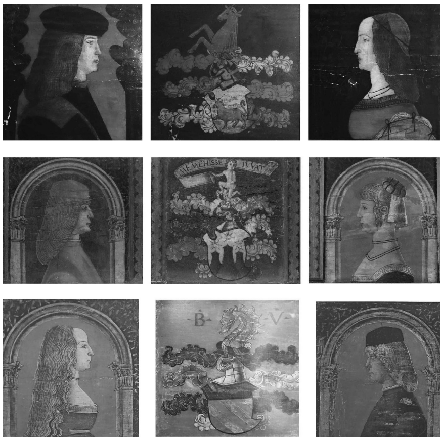
Fig. 5. Bottega cremasca, tavolette da soffitto, ultimo quarto del XV secolo, tempera su tavola, dall'alto: Chichester (Sussex), West Dean College; Boston, Isabella Stewart Gardner Museum e Milano, Museo Poldi Pezzoli.