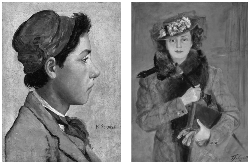
Fig. 2. Raffaello Sernesi, Florentine brat , about 1861, oil on canvas, 30,5x24 cm, Crema, Civic Museum of Crema and Cremasco (inv. B0573).