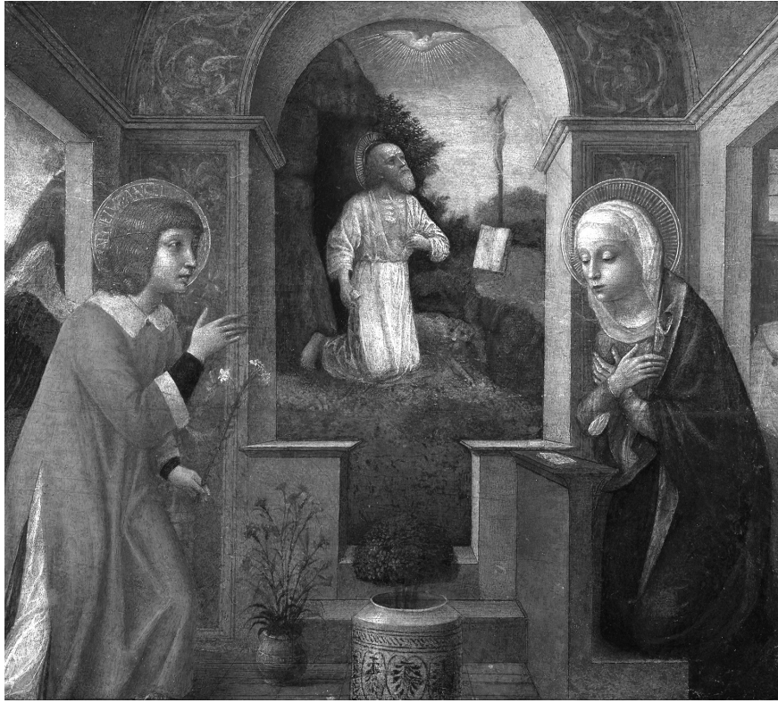
Fig. 1. Vincenzo Foppa, Annunciation with the penitent Saint Jerome , about 1460-1490, tempera on panel, 51x64 cm, Crema, Civic Museum of Crema and Cremasco (inv. Bo558).