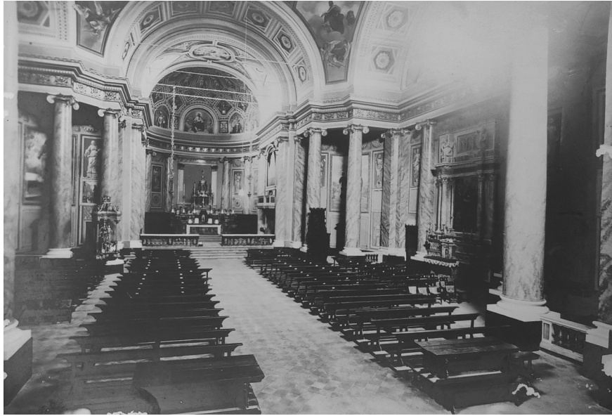
Fig. 4. APRO, Interno della chiesa parrocchiale di Romanengo nel 1929. Si noti l'organo Serassi nel presbiterio.

Nonostante lo zelo con cui il parroco di Romanengo, in veste di sub-economista di Soncino, avesse chiesto personalmente la possibilità di aprire un mutuo con la fabbriciera di Izano per ottenere la somma richiesta, a inizio agosto l'autorizzazione non era ancora pervenuta in parrocchia.