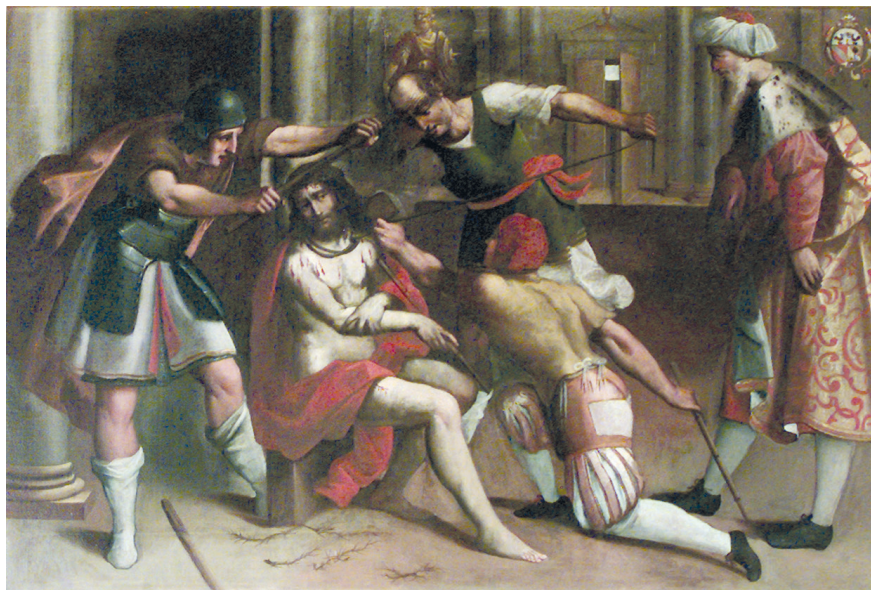
Fig. 2. Tomaso Pombioli, Incoronazione di spine , 1606, olio su tela, 125x185 cm, Leffe, San Rocco (Archivio fotografico della Diocesi di Bergamo).

con buona probabilità eseguite in diversi momenti. Se la Deposizione nel sepolcro spetta a un veneto tardo manierista gravitante nell'orbita dei cosiddetti pittori delle "Sette Maniere" 20 , le altre tre, raffiguranti l' Orazione nell'orto del Getsemani (fig. 1), l' Incoronazione di spine (fig. 2) e Cristo inchiodato alla Croce (fig. 3) sono da accostare all'artista cremasco e recano lo stemma della famiglia Gallizioli: sul Cristo inchiodato in particolare, accanto all'emblema figurano le iniziali del committente, S.G., che si potrebbero sciogliere in Santo Gallizioli 21 , e la data 1606 (fig. 4). Il