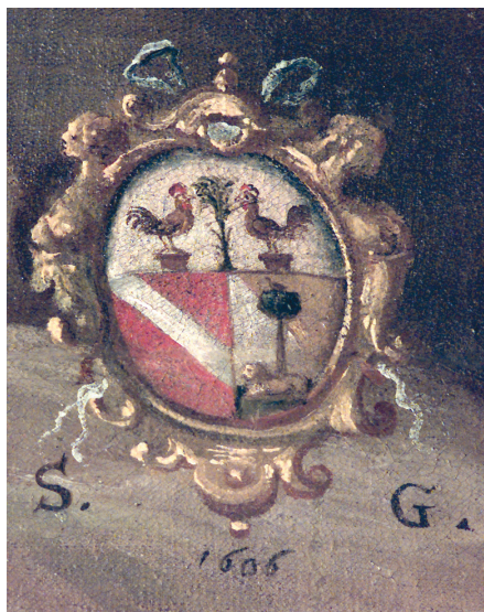
Fig. 4. Tomaso Pombioli, Gesù inchiodato alla croce , particolare dello stemma Galizioli con la data 1606.

zione delle commissioni. Dal punto di vista della composizione, riconosciamo la tendenza di Pombioli, soprattutto nelle tele di piccolo formato, a serrare le figure in primo piano creando poi focus narrativi secondari tramite piccoli inserti di scene nel paesaggio. Un'impostazione più dilatata e su più piani appare nell' Orazione , con gli apostoli e Cristo incastonati all'interno di un panorama roccioso a lume notturno, di matrice campesca, che vede la luce penetrare negli anfratti e investire i protagonisti della scena con effetti di delicato luminismo descrittivo che ci restituisce in maniera minuta perfino il profilo azzurro,