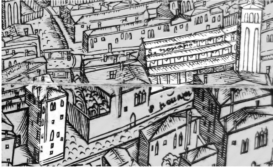
Fig. 1. J. DE BARBARI, Veduta di Venezia , 1500, dettaglio. Evidenziate, in alto a destra la chiesa di San Trovaso, in basso a sinistra la presunta casa di Maria Savorgnan. Il Campo di San Trovaso fiancheggiava la casa con giardino, al centro, su due lati. Gli edifici purtroppo si trovano lungo la linea che delimitava le matrici di legno utilizzate per la stampa della mappa.

dal campo di San Trovaso che più si adatta a questa configurazione è quella di Campiello del Magazen 1372 31 .